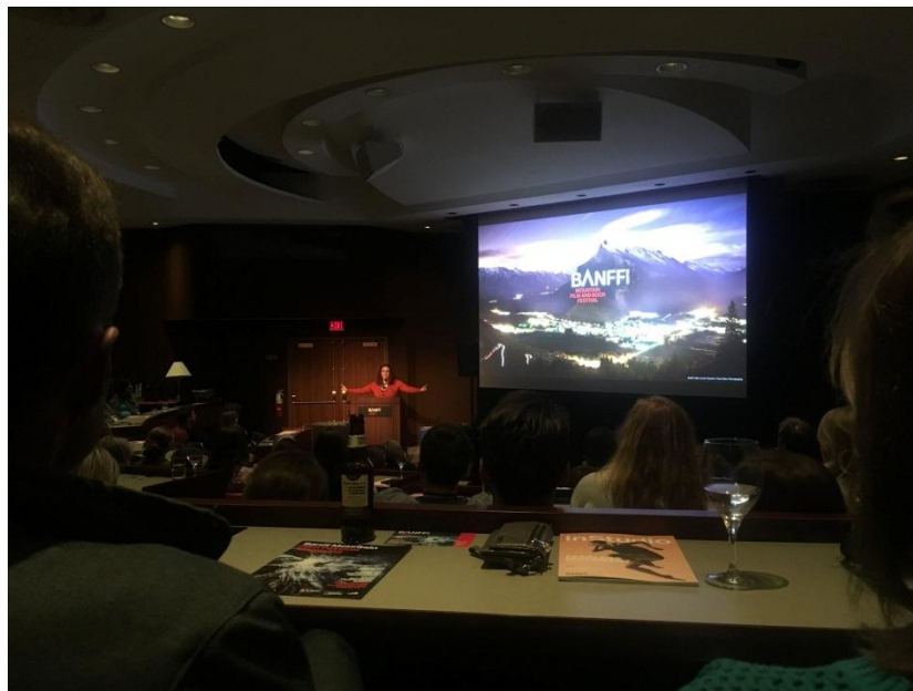
Adventure ELEVATE 2018, Banff, Canadá.

Hay espacio para 250 delegados con un enfoque para el comercio de viajes en esta región, siendo una combinación de operadores turísticos y asesores de viajes, medios de comunicación, socios de la industria, juntas de turismo internacional y las empresas de gestión de destinos.