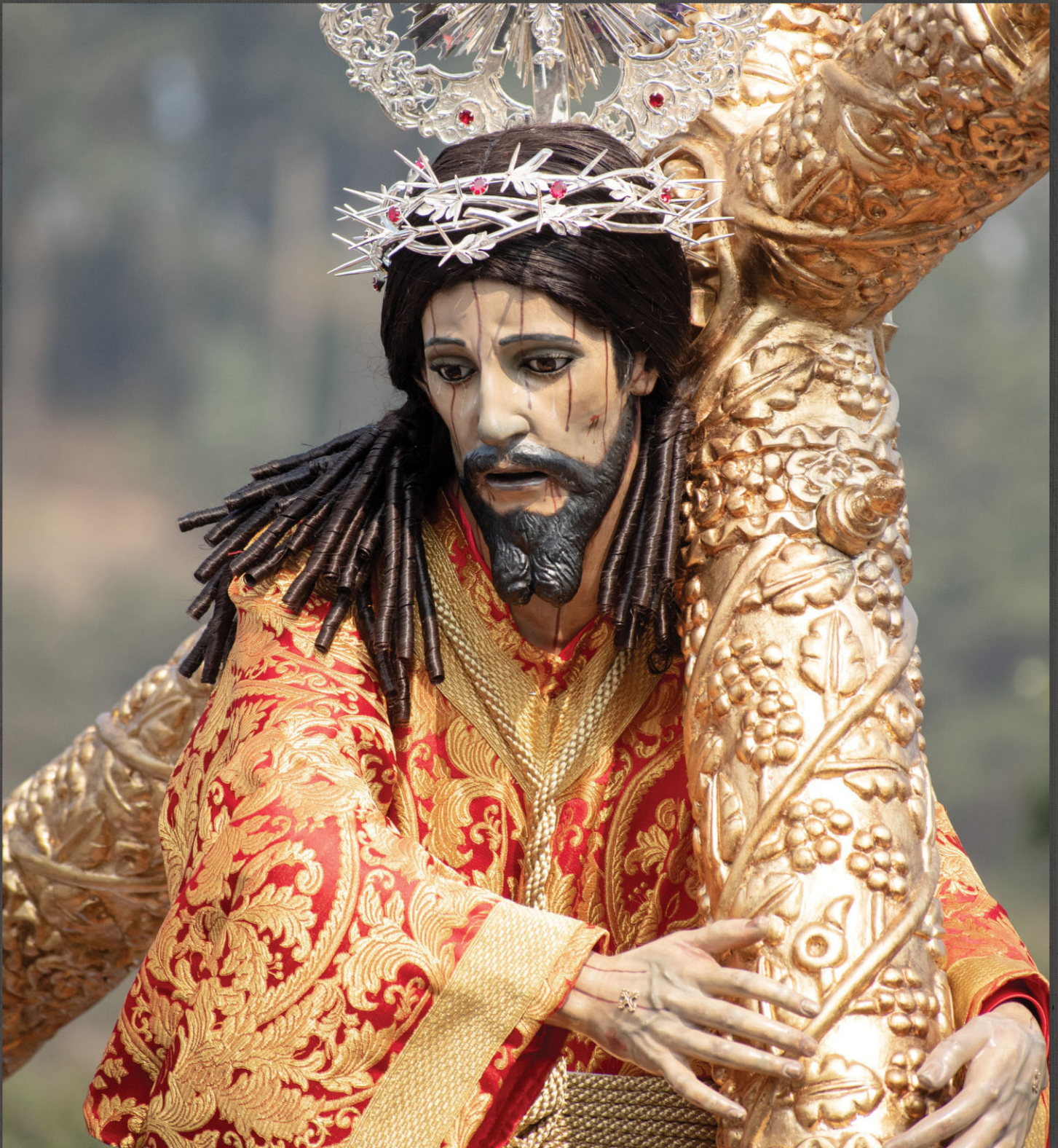
JESÚS NAZARENO DEL MILAGRO, SANTUARIO SAN FELIPE DE JESÚS