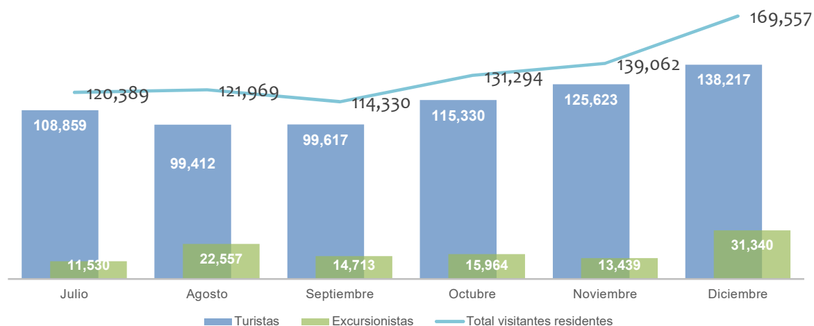
Visitantes residentes Julio - Diciembre 2022

* Nota: a partir de julio 2009 se utiliza la variable "país de residencia" para la clasificación del visitante, de acuerdo a recomendaciones de la -OMT-.