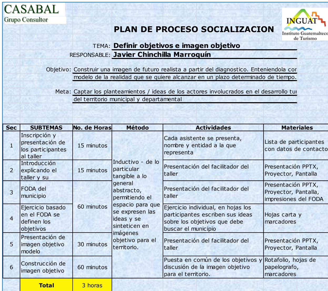
Cuadro 2. Plan de los talleres para el Departamento de Sacatepéquez, Guatemala.