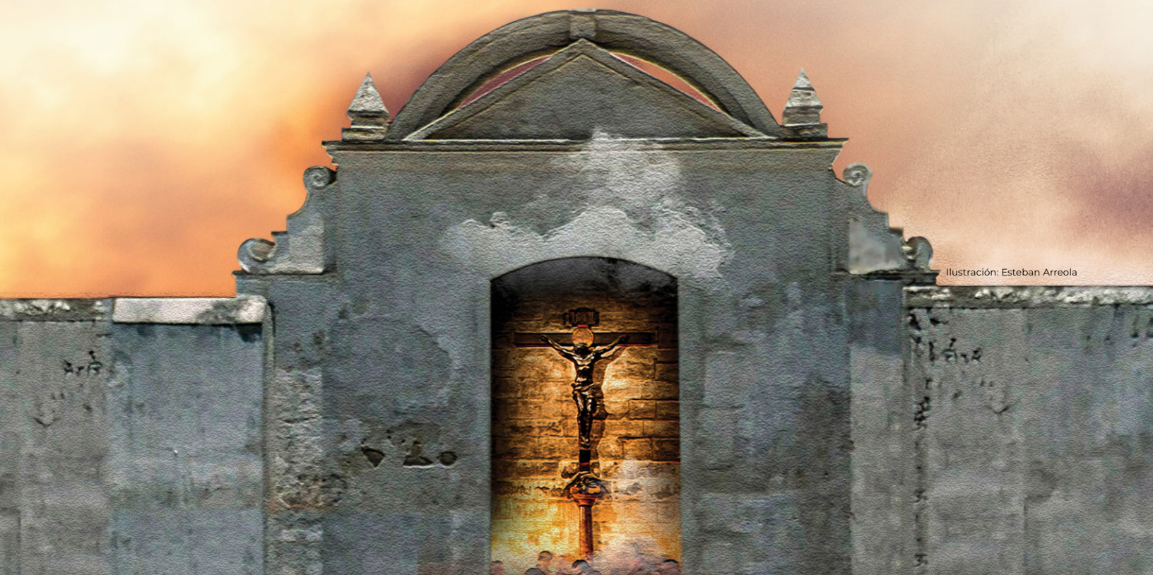
Ilustración: Esteban Arreola

El trayecto de la estación ocupa desde la Parroquia del Espíritu Santo hasta el Nuevo Calvario, la primera capilla se encontraba en la antañona Calle de las Ánimas, actual 7. a calle y 12. a avenida esquina, la última de las capillas aún se encuentra a los pies del Nuevo Calvario. El paso más tradicional de “La Estación” procesional es la 12. a avenida y 7. a calle, hasta la 9. a calle para doblar y buscar la 8. a avenida y retornar al Parque Centroamérica por la 6. a calle, al finalizar este recorrido ya cada procesión busca su templo.